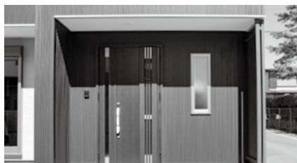
ブラウンで統一された玄関