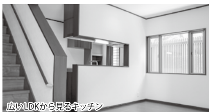
広いLDKから見るキッチン