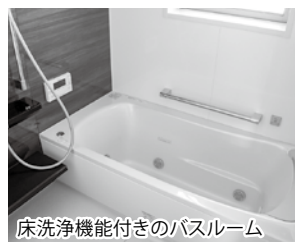
床洗浄機能付きのバスルーム

●所在地/磐田市国府台103-3 ●敷地面積/160.34㎡(48.50坪) ●建物面積/1F 58.79㎡(17.78坪)2F 57.13㎡(17.28坪) ●延床面積 115.92㎡(35.06坪) ●構造/木造2階建 ●屋根/合金メッキ鋼板葺(ガルバリウム) ●外壁/ガルバリウム+サイディング ●設備/シャワー付洗面化粧台、暖房付洋式便器(ウォシュレット付)、カラーTVインターホン、オール電化住宅、エコキュート ●確認番号/H30年10月22日 第H30確認建築静建住ま09064号