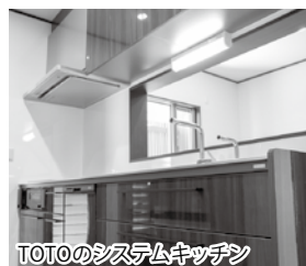
TOTOのシステムキッチン