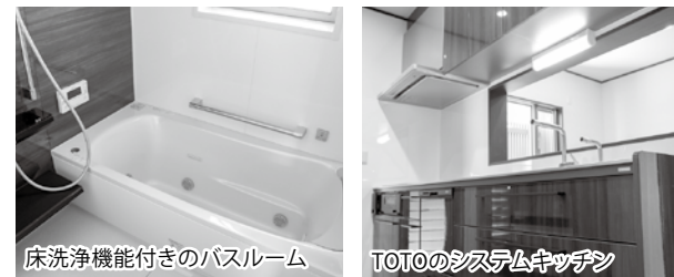
床洗浄機能付きのバスルーム